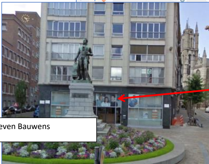
Standbeeld Lieven Bauwens